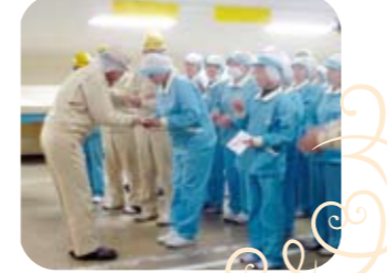
2013/12/13 紀三井寺分工場 第一セットNo1にて